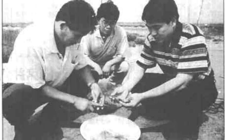
垦利县红光办事处大力加强干部示范服务基地建设，今年他们引进虾蟹对虾、斑节对虾进行的养殖试验获得了成功。目前两种成虾分别达到12公分、8公分，且两种虾抗病性强，又能有效避开了虾病暴发高峰期，从而为虾农增收找到了一条好途径。该基地也成了引导农民致富的科技示范园。

农下渔项目2000亩。其中，“三元”开发利用其鱼池、藕池、大棚三者之间的生态效应，大棚暂养鱼蟹、鱼池水浇藕。“三元”开发区260亩，区内鱼池60亩，藕池60亩，水库120亩，沟渠20亩，共建鱼池、蟹暂养大棚12个。鱼蟹暂养大棚的建造，做到了旺季蓄、淡季销，有效地打好了时间差和价格差，一个大棚可年纯收入3万元。(来廷鹏)